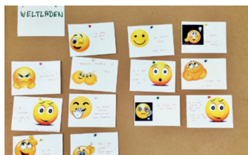
Smilies helfen den einzelnen Teams beim Jahresrückblick.

Im Rahmen von Gramit (Grabser Missionsteam) treffen sich jeweils Anfangs Jahr alle Gefässe aus dem Bereich Mission (Brot für alle, Weltladen, Missionssammlerinnen und 2-Stunden Lauf) zum Austausch und zum gemeinsamen Kontakt. So finden wertvolle Begegnungen statt. Das Thema «Mission» in unserer Kirchgemeinde wird gestärkt.