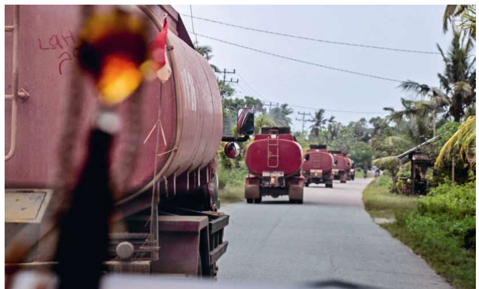
8000 Liter Palmöl transportiert einer der unzähligen Lastwagen, die oft in langen Kolonnen Richtung Küste fahren. Erntezeit ist rund ums Jahr.

Für die Brot für alle Kommission Anni Vetsch