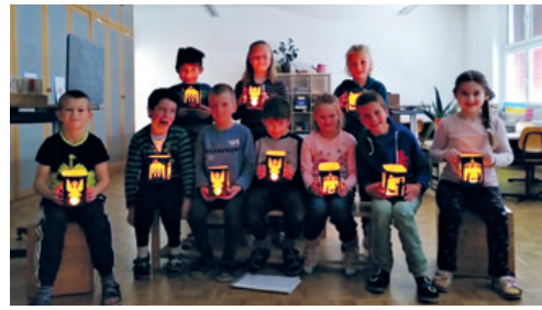
Auch Schulkinder (hier die 2. Klasse Berg) bastelten eine kleine Ausgabe der Laterne.